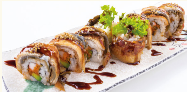
8 Osaka Roll 15,50 € Aal, Surimi, Avocado, Fischrogen mit Unagisoße D,N