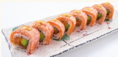
10 Tokio Roll gegrillt 14,00 € Leicht gegrillter Lachs, Avocado C,D