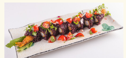
41 Kuro Ebi Roll 14,00 € Panierte Garnelen mit schwarzem Reis, Ruccola, Surimi, Avocado, Tomaten und Koriander A,D