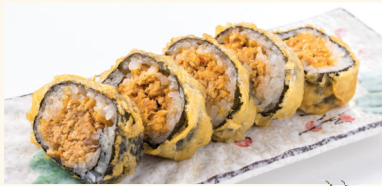
4 Crispy Spicy Tuna Roll 7,90 € Thunfisch mit Unagisoße A,C,D