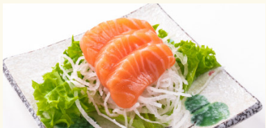
S1 Shake Sashimi 6,00 € Lachs D