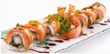
16 Dragon Roll gegrillt 16,80 € Lachs, pan. Garnelen, Avo, Rucola, Kürbis, Fischrogen, Frischkäse, Unagisoße A,C,D,G