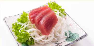
S2 Tekka Sashimi 6,50 € Thunfisch D