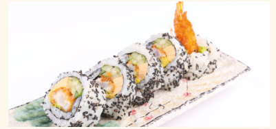
3 Haru Maki 6,90 € Ei, Gurke, Avocado, panierte Gar- nelen und schwarzer Sesam A,B,C,N