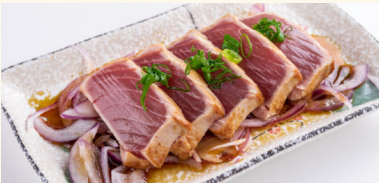
S5 Thunfisch 8,50 € Leicht gegrillt mit Ponzusoße D,F