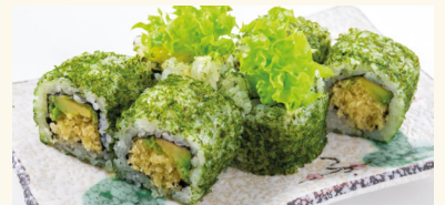
12 Crispy Roll 6,90 € Avocado, Tempura und Mayo A,C