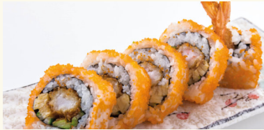
5 Aki Maki 6,90 € Gurke, Ei, panierte Garnelen und Fischrogen A,B,D