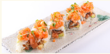
40 Phoenix Roll 12,50 € Frittierter Aal, Lachstarter, Avocado, Frischkäse und Soße A,C,D,G