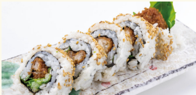
7 Chicken Roll 6,90 € Frittiertes Huhn, Gurke, Rucola, Yakitorisoße A,C,N