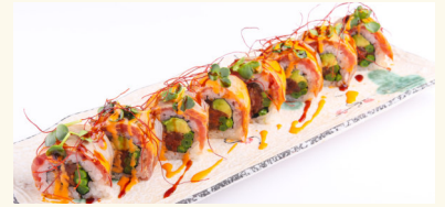
18 Sakura Roll 15,50 € Thunfisch gegrillt, Avocado, Bohnen, Paprika, mit Unagisoße A,C,D