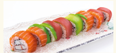
9 Rainbow Roll 12,90 € Surimi, Lachs, Thunfisch und Avocado C,D,E,N,O