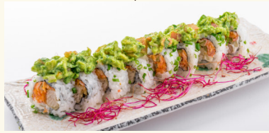
17 Tuna Roll 10,90 € Frittierter Thunfisch mit Surimi, Gurke und Guacamole A,C,D