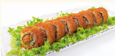
13 Summer Roll 12,70 € Frittiertes Sushi mit Lachs A,C,D