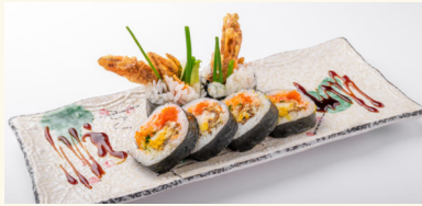
19 Spider Roll 10,50 € Masago, Surimi, Avocado, Soft Crab und Aal A,B,D