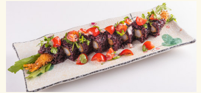
41 Kuro Ebi Roll 14,00 € Panierte Garnelen mit schwarzem Reis, Ruccola, Surimi, Avocado, Tomaten und Koriander A,D