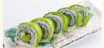
6 Green Maki 6,50 € Rettich, Gurke und Avocado mit Gomadressing E,N,O