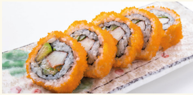
1 California Roll 6,50 € Surimi, Gurke, Avocado und Fliegenfischrogen C,D