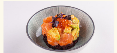
S6 Kuromai Shake 8,50 € Lachstarter mit schwarzem Reis und Avocado C,D,F,N