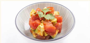
S4 Tartar vom Thunfisch Thunfisch mit Avocado C,D,F,N 10,50 €