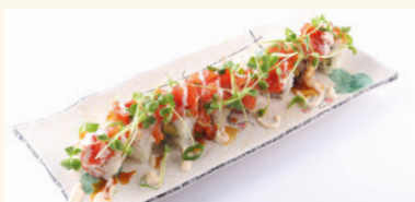
14 Volcano Roll 13,50 € Frit. Thunfisch, Thunfischtartar, Avocado, Frischkäse, Soße A,C,D,G