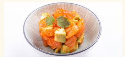
S3 Tartar vom Lachs 8,50 € Lachs mit Avocado C,D,F,N