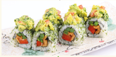
2 Midori Roll 7,80 € Guacamole, Paprika, Bohnen, Inari, Shinko F