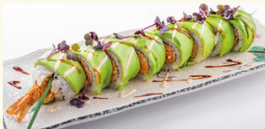
11 Ebi Avo Roll 13,50 € Avocado, panierte Garnelen, Suri- mi und Tempura mit Soße A,B,C,D