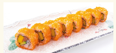
15 Mango Roll 12,80 € Mango, Lachs, Avocado und Fischrogen C,D